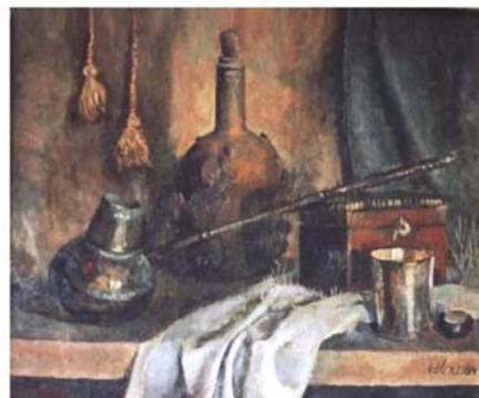
«В память о Шардене», 1984 холст, масло, 40х50