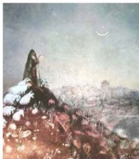
“Видение”, 1991 бумага, смеш. техника 34x47

чутко улавливает национальные мелодии. Они близки художнице и незримыми нитями связаны с тем, что она создает. Опосредовано, разумеется, но связаны.