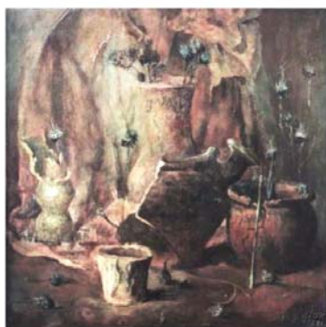
«Разбитые кувшины», 1981 холст, масло, 60х61