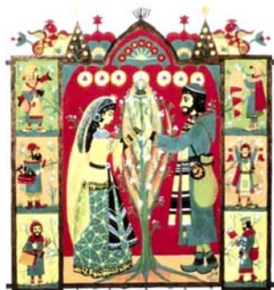
“Деревянная Принцесса”, 1979, (занавес к мюзиклу по еврейской народной сказке), бумага, темпера, 57х63