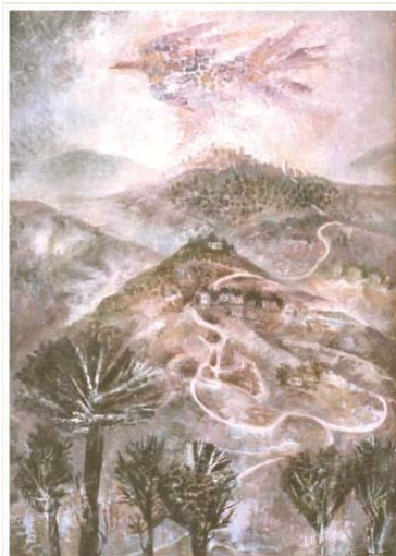
“Дорога в Иерусалим” (Иудейские горы), 1999 холст, масло, 90x60

Ителла Мастбаум – художник искренний и преданный искусству, и хочется верить, что жизнь ее дальнейшая сложится так, что она сможет полностью раскрыть себя в творчестве. Это было бы справедливо.