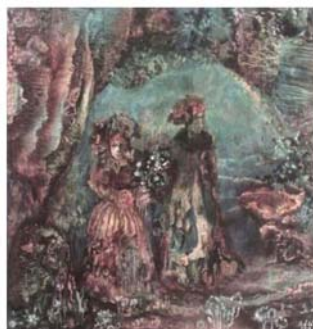
“Прогулка в Долеве”, 1999 бумага, смеш. техника 21x21

То, что я написал об Ителле Мастбаум, не является, конечно, критической статьёй о её творчестве. Да и задачи такой себе не ставил. Поэтому оставляю в стороне анализ произведений художницы. Он еще, надеюсь, ожидает её впереди. Ею пройден определенный путь внутреннего созревания. Мы знаем, что это такое, сколько за этим стоит труда, разочарований, радости.