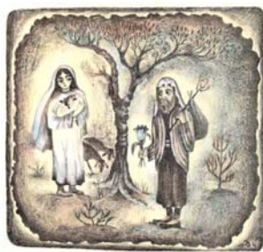
“Встреча Рахели и Якова”, 1976 (из серии женщины Танаха) » автолитография, ручная раскраска, 44x46

самостоятельность взглядов, отсутствие заимствований. Художница понимает, что чужая фантазия может сковать собственную.