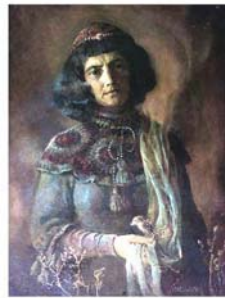
“Автопортрет”, 1985 холст, масло 67x87

В полутьме холста нерезко виднеется лицо женщины и мерцает немного напряженный и внимательный, как бы следящий за вами, взгляд глубоких и печальных глаз.