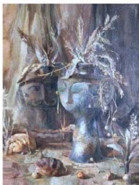
«Ваза с отражением», 1980 холст, масло, 48х62

присущие только серьёзным художникам: веру в себя, сомнение в своих силах и любовь к тому, что делает в искусстве.