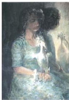
“Фантазёрка”, 1981 холст, масло, 60x73

Сквозь привычные предметы, изображенные на стоящем рядом натюрморте, причудливо прорастают ветви дерева. Они движутся, струятся, пронизывают всё и окутывают предметы какой-то невысказанной тайной. Свечение необычного в обычном. А вот большие графические листы к народным еврейским песням. Они сказочны и поэтичны. Сквозь добрую улыбку любви и сочувствия проступает потаённая, естественная как дыхание, грусть. Мне вспоминаются слова Леонидова о Михоэлсе: «... и только грусть – еврейская, вечная».