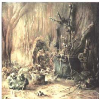
“Долгое ожидание весны”, 1978 холст, масло, 80x80

Как живописец, не могу не обратить внимания на колоризм ее работ. Это, безусловно, одно из её достоинств.